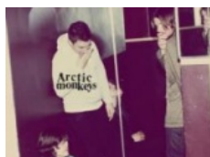
ARCTIC MONKEYS: "Humbug"