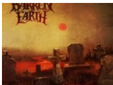
BARREN EARTH: "Curse Of The Red River"