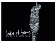
LAKE OF TEARS: "By the Black Sea"