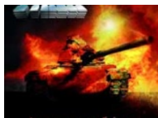
TANK: "War Machine"