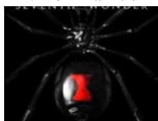
SEVENTH WONDER: "The Great Escape"