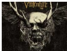
VALLENFYRE: "A Fragile King"