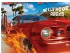
WHEELS OF FIRE: "Hollywood Rocks"