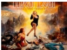
MEAT LOAF: "Hang Cool Teddy Bear"